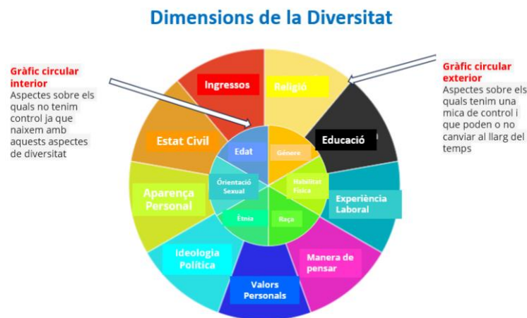
Figura 2. Roda de la diversitat.

De quina forma pot ser divers l'alumnat?