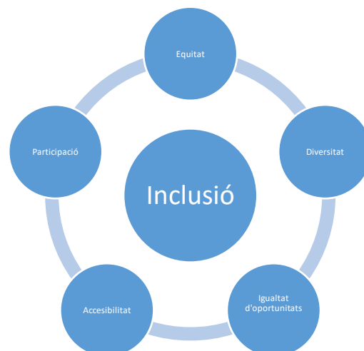
Figura 1. Principis de la inclusió.

Encara que molts càlculs i descripcions dels principis de la inclusió a l'educació mostren el predomini de les qüestions relacionades amb les discapacitats dels/les estudiants, centrar-se en cada cas en el marc de la diversitat humana permet anar més enllà dels desafiaments purament educatius. Per tant, la internacionalització inclusiva es pot considerar des de la perspectiva del següent supòsit sobre l'educació inclusiva : L'educació inclusiva implica un canvi fonamental en el sistema educatiu existent, passant de considerar la diferència com un problema que cal solucionar a celebrar la diversitat dels/les estudiants i proporcionant tot el suport necessari per permetre una participació en igualtat de condicions ( https://www.allfie.org.uk/about-us/our-principles/ ).